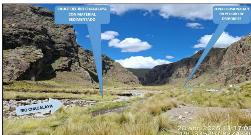
FIGURA 1 y 2 : TRAMO CRÍTICO EN EL RÍO CHACALAYA, EN EL SECTOR CAYACHIRA, DISTRITO DE SANTA LUCIA, PROVINCIA DE LAMPA - PUNO. NOTESE, LA ACUMULACION DE MATERIAL SEDIMENTADO EN EL CAUCE, QUE REQUIERE SER ELIMINADO PARA REESTABLECER LA SECCIÓN HIDRAULICA DE LA CAJA DEL CAUCE EN ESTE SECTOR.